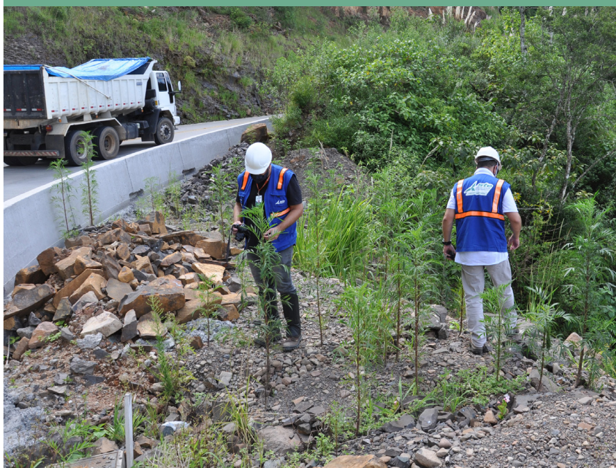
A Gestora Ambiental supervisiona a execução de ações que visam a recuperação de áreas degradadas

No dia 15 de abril se comemorou o Dia Nacional da Conservação do Solo, conforme previsto na Lei Federal nº 7876, de 13 de novembro de 1989. A data propõe uma reflexão sobre a importância desse recurso natural e a necessidade de seu uso e manejo sustentáveis. Nas obras da BR-285/RS/SC, o DNIT executa uma série de medidas que visam proteger o solo e recuperar ambientalmente as áreas afetadas durante o processo de construção da rodovia.