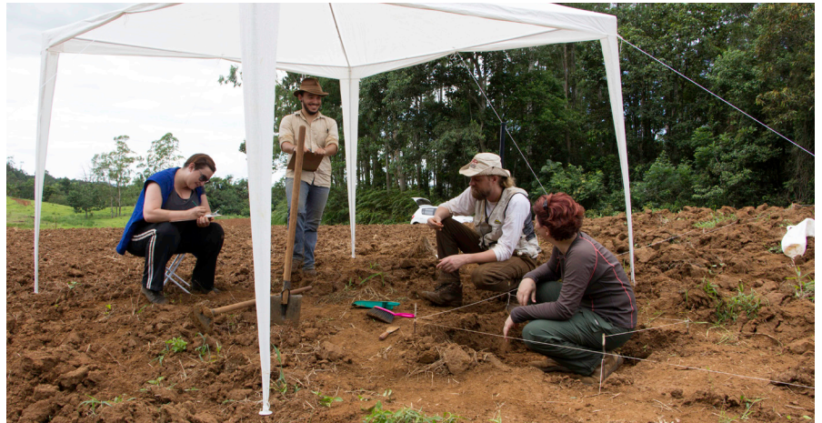
Escavações revelaram materiais de pedra lascada e polida denominados de artefatos líticos