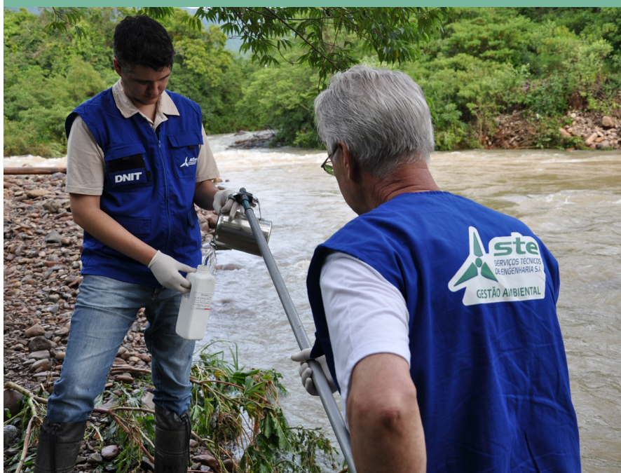
Monitoramento da qualidade da água visa prevenir e minimizar impactos aos recursos hídricos

Para atender a exigências ambientais, a obra conta com estudos que contemplam a área de influência, além da Licença de Instalação nº 860/2012 emitida pelo Instituto Brasileiro do Meio Ambiente e dos Recursos Renováveis (IBAMA). O objetivo da Gestão Ambiental é minimizar, prevenir ou compensar os impactos negativos e potencializar os positivos. No empreendimento são executados 24 Programas Ambientais que incluem cuidados com a fauna, a flora, o solo, os recursos hídricos, as populações lindeiras, entre outras ações de cunho ambiental.