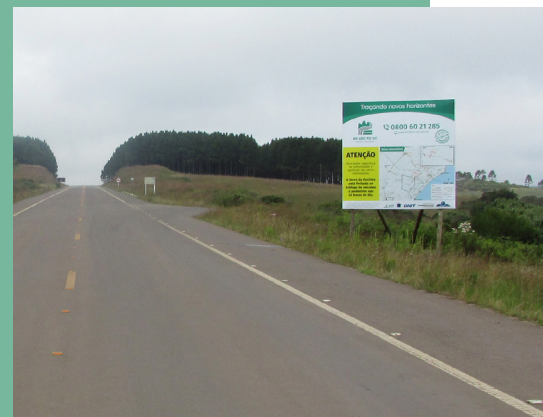
Placa instalada em São José dos Ausentes (RS)

Areia (na BR-101) pela Rota do Sol; RS-020 em direção a Cambará do Sul, cujo acesso pela BR-285 fica há cerca de quatro quilômetros da divisa entre RS e SC, devendo o motorista seguir pela Serra do Faxinal (RS-427 e SC-290) até Praia Grande (SC); BR-116, de Vacaria (RS) a Lages (SC), seguindo pela SC-114 e SC-390 até a BR-101 em Içara (SC) ou Sombrio (SC). O DNIT informa que cabe aos usuários verificar as condições de tráfego destas rodovias.